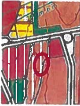
Obrázok 2 Výrez z ÚPN HSA