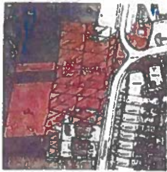
Obrázok 1. Výrez z ortofotomapy s podľa priloženej grafiky žiadosti

Oddelenie Útvár hlavného architekta mesta Košice Vám z územnoplánovacieho hľadiska zasiela nasledovné stanovisko: