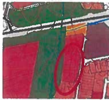
Obrázok 3 Výrez z nového ÚPN-M

Predmetné parcely sú v zmysle v súčasnosti platného Územného plánu hospodársko-sídelnej aglomerácie Košice (ďalej len ÚPN HSA ) súčasťou plôch funkčne definovaných ako obytné plochy málopodlažnej zástavby – návrh , vo východnej časti ako stav . V súčasnosti platné regulatívy ÚPN HSA regulujú v takto definovanom území minimálne percentuálne podiely zelene podľa formy zástavby samostatne stojace rodinné domy 60%, progresívne formy zástavby (radové domy, dvojdomy, átriové domy, terasové domy, málopodlažné bytové domy) 40%. Rovnako určujú vytvárať podmienky pre zadržiavanie dažďovej vody na zastavanom území mesta (vsakovaním, zachytávaním v nádržiach, jazierkach, využívaním pre úžitkové účely),